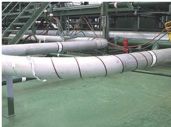
Tracejado em espiral