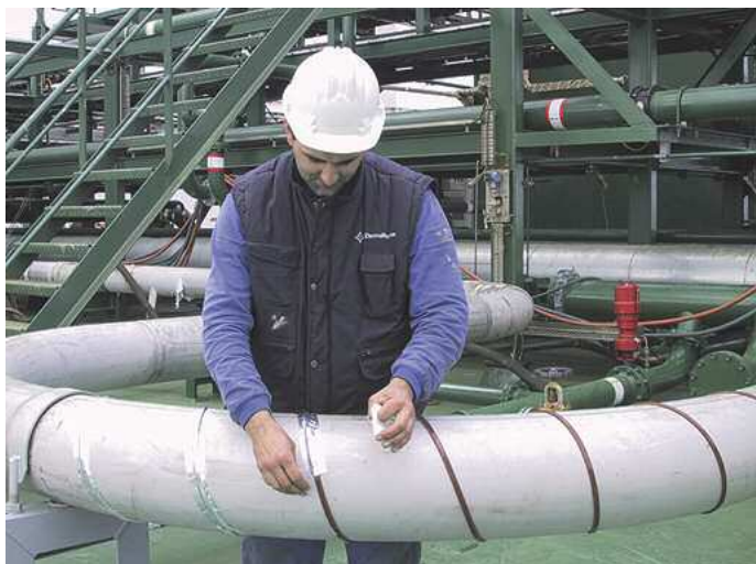
Encintado do tracejado