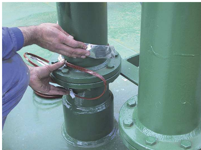
Tracejado de uma brida